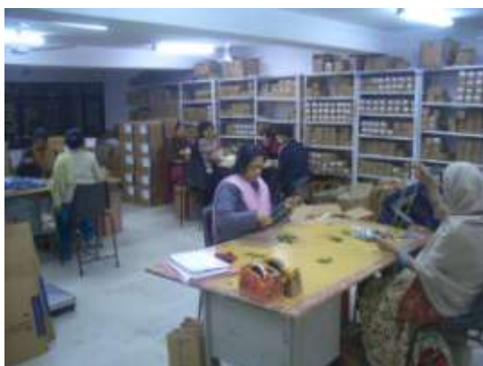
フェアトレード商品(アクセサリ)を作る女性たち