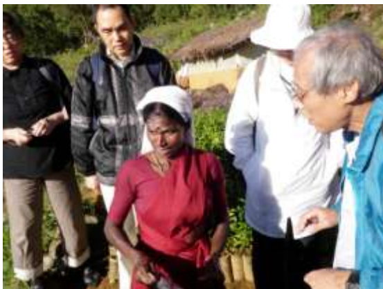
茶園労働者に話を聞く様子

■生産者は誇りを持って茶葉を摘み、給料を受け取り休日もある。…(中略)…日本に住み、彼らの生活を思い描いているだけでは想像の域を出ないが、実際に訪問したところ、実は当り前の生活を当り前に送っていることを確認できた[40代女性]