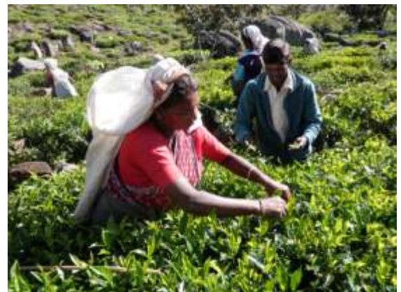
ウバ紅茶の茶葉を摘む様子