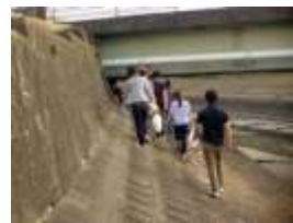
野宿者に支援物資を届けるスタッフ