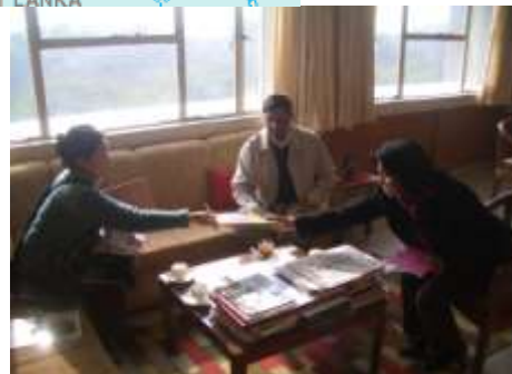
支援概要について説明をするプロジェクト責任者