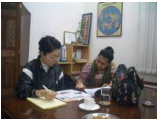
支援概要について説明をするプロジェクト責任者