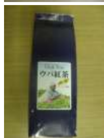
フェアトレード商品のスリランカ産無農薬ウバ紅茶（上：ティーバッグ、左：リーフ）

トレードがどのような定義で何をめざすのかについては、それぞれの団体の活動理念に照らし合わせながら、組織ごとに異なる意味づけを行うのが現状である。JIPPOはフェアトレード指針として以下のことを念頭において活動した。